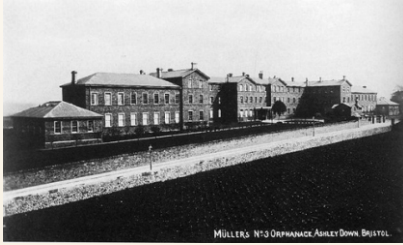
Müller György 3. sz. árvaháza Bristolban

Élete mindennél hangosabban hirdeti, hogy Isten imát meghallgató, szerető menyeei Édesapánk. Bristoli árvaházaiban napról napra kétezer árváról gondoskodott. 1836-tól 1898-ig több mint kétmillió Bibliát és különféle evangéliumi iratot osztott szét. 70 éves volt, amikor utazni kezdett. 42 országot látogatott meg, és több ezer alkalommal tett bizonyágot Isten hűségéről